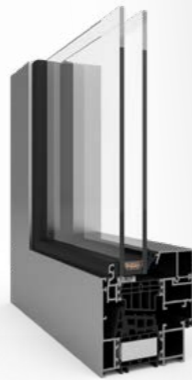
MB-86 US AERO